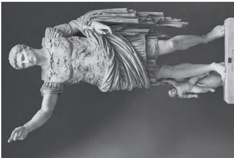
Fot. 1. August z Prima Porta. Ilustracja na licencji Creative Commons

(Źródło: http://upload.wikimedia.org/wikipedia/commons/thumb/e/eb/Statue-Augustus.jpg/400px-Statue-Augustus.jpg , dostęp: 25.02.2013)