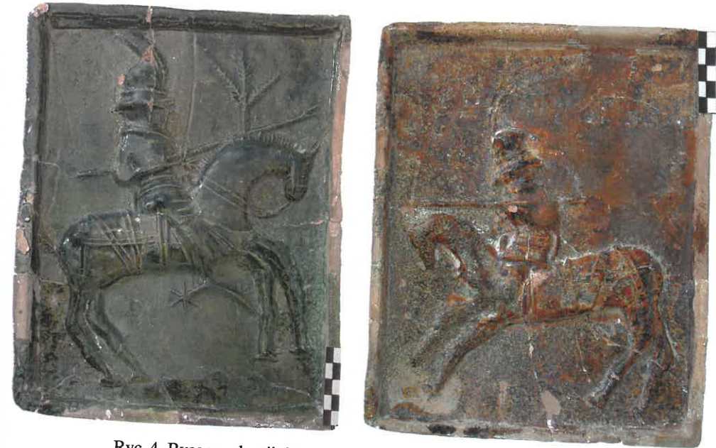
Ryc. 4. Rycerze „kopijnicy”. Chudów – Zamek, II połowa XV wieku.