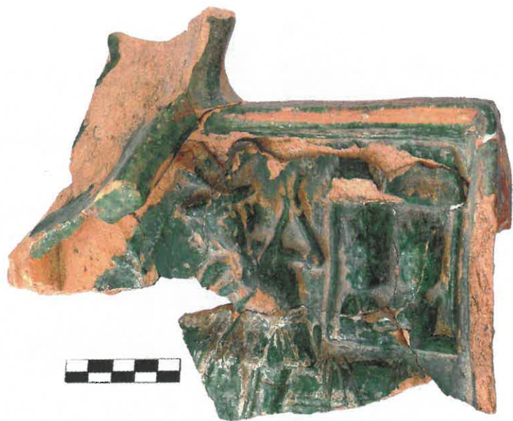
Ryc. 6. Kafel narożny z trójkątną tarczką z przedstawieniem św. Jerzego. Chudów – Zamek, II połowa XV wieku.