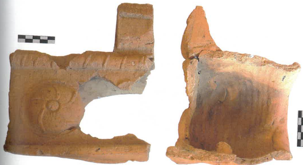
Ryc. 11. Kafel gzymsowy, rozdziałający skrzynię pieca. Ornament rozetowy. Chudów – Zamek, II połowa XVI wieku.

Jest to najliczniejsza grupa kafli, wśród których znalazło się wiele przedstawień figuralnych, geometrycznych oraz stylizowanych rozet. Całokształt charakterystycznych cech jest dość typowy dla tego okresu, są to często przedstawienia pod arkadą, nierzadko z motywami architektonicznymi – maswerkami. Czytelny relief w dalszym ciągu wyraźnie obwiedziony jest ramką, często z rozbudowanym profilowaniem. Polewy to różne odcienie barwy zielonej, rzadziej brązowej. Stwierdzono także obecność części kafli (np. niektóre rozety) bez glazury. W zespole tym znajdują się wszystkie rodzaje kafli niezbędnych do budowy kompletnego pieca. Poza (najliczniejszymi) kaflami wypełniającymi, znalazły się również gzymsowe-rozdziałające skrzynię pieca (ryc. 11), kafle wieńczące, wśród których ciekawym egzemplarzem są meluzyny trzymające tarczę herbową (ryc. 12) oraz kafle bazowe, stanowiące podstawę pieca (ryc. 13). Wiele z kafli ma okopcenia wewnętrznych powierzchni oraz przywarte fragmenty gliny wypełniającej, co dowodnie świadczy o ich wykorzystaniu w piecu. Warsztat, podobnie jak w przypadku pierwszych dwóch grup, najprawdopodobniej miejscowy, surowiec to w większości gliny żelaziste, rzadziej kaolinitowe o charakterystycznej, jasnej barwie.