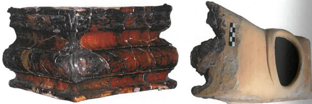
Ryc. 10. Kafel bazowy. Chudów – Zamek, I połowa XVI wieku.