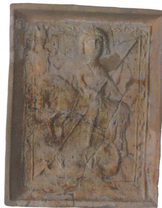
Ryc. 8. Święty Jerzy zabijający smoka. Chudów – Zamek, I połowa XVI wieku.

należące do tej grupy są nieco większych rozmiarów z charakterystycznymi dla tego okresu cechami – motyw zdobniczy obwiedziony jest profilowaną ramką, często z dodatkowymi elementami dekoracyjnymi (np. florystycznymi, geometrycznymi). Powierzchnie ich pokrywa glazura ołowiowa koloru zielonego i brązowego w różnych tonacjach, znane są także egzemplarze bez polewy. Tak jak w pierwszej grupie, najciekawsze przykłady stanowią kafle z ornamentem figuralnym. Są to m.in. kafle z młodzieńcem pod arkadą (ryc. 7), św. Jerzym na koniu (ryc. 8), a ponadto z pseudomaswerkiem i rozetą (ryc. 9) i unikatowe kafle bazowe (ryc. 10). Poszczególne egzemplarze w tej grupie posiadają w swoim zdobnictwie jeszcze elementy charakterystyczne dla poprzedniego okresu, jednak obecność cech renesansowych, które razem z cechami warsztatowymi i metrycznymi lokują je wśród kafli szesnastowiecznych, ostatecznie przesądza o ich metryce. Do grupy drugiej zaliczono 1111 fragmentów kafli. Wyróżniono dziewięć wzorów ornamentacyjnych, pochodzących zapewne z kilku urządzeń grzewczych. Na wewnętrznych powierzchniach widnieją ślady okopcenia, co wskazuje na ich użycie w bryle pieca.