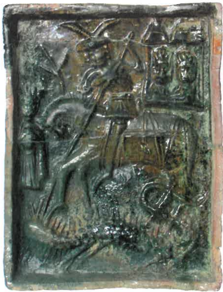
Ryc. 3. Święty Jerzy zabijający smoka, któremu przygląda się para królewska. Chudów – Zamek, II połowa XV wieku.

z ornamentem figuralnym, w tym św. Jerzego zabijającego smoka (ryc. 3), rycerzy kopijników, zapewne w scenie turniejowej (ryc. 4) i św. Krzysztofa (ryc. 5). Warsztat technologiczny stał na niskim poziomie, widoczne są liczne spękania, różnice metryczne poszczególnych kafli oraz niedokładne rozłożenie polewy. Interesujące w tym zbiorze okazały się kafle narożne z trójkątną tarczką na narożu (ryc. 6). Na wielu kafkach zachowały się ślady okopcenia powierzchni wewnętrznych oraz przywarta glina. Do tej grupy zaliczono dotychczas 1099 fragmentów kafli. Na obecnym etapie badań trudno stwierdzić, kto zlecił ich wykonanie. Być może byli to pierwsi właściciele Chudowa, którzy postawili te piece w drewnianej rezydencji. Pozostałością tej fazy jest odkryty ciąg dołów postupowych, wyznaczający zasięg drewnianego założenia.