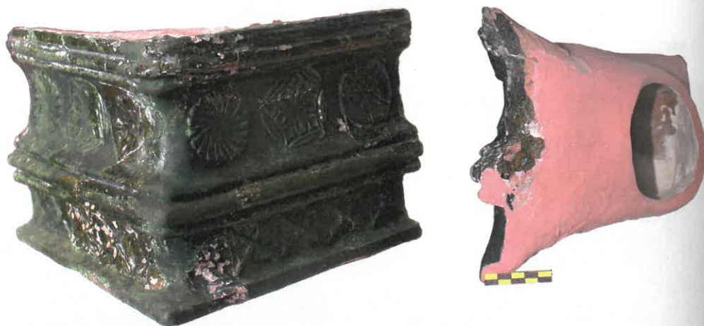
Ryc. 13. Kafel bazowy. Chudów – Zamek, II połowa XVI wieku.