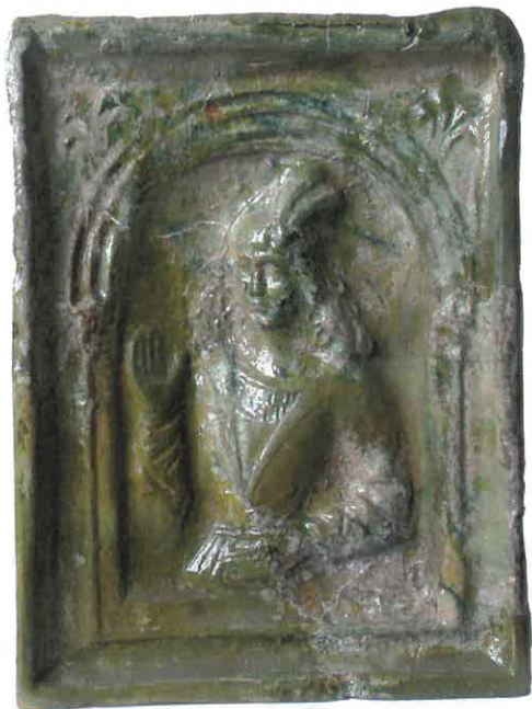
Ryc. 7. Młodzieniec pod arkadą w geście pozdrowienia. Chudów – Zamek, I połowa XVI wieku.

należące do tej grupy są nieco większych rozmiarów z charakterystycznymi dla tego okresu cechami – motyw zdobniczy obwiedziony jest profilowaną ramką, często z dodatkowymi elementami dekoracyjnymi (np. florystycznymi, geometrycznymi). Powierzchnie ich pokrywa glazura ołowiowa koloru zielonego i brązowego w różnych tonacjach, znane są także egzemplarze bez polewy. Tak jak w pierwszej grupie, najciekawsze przykłady stanowią kafle z ornamentem figuralnym. Są to m.in. kafle z młodzieńcem pod arkadą (ryc. 7), św. Jerzym na koniu (ryc. 8), a ponadto z pseudomaswerkiem i rozetą (ryc. 9) i unikatowe kafle bazowe (ryc. 10). Poszczególne egzemplarze w tej grupie posiadają w swoim zdobnictwie jeszcze elementy charakterystyczne dla poprzedniego okresu, jednak obecność cech renesansowych, które razem z cechami warsztatowymi i metrycznymi lokują je wśród kafli szesnastowiecznych, ostatecznie przesądza o ich metryce. Do grupy drugiej zaliczono 1111 fragmentów kafli. Wyróżniono dziewięć wzorów ornamentacyjnych, pochodzących zapewne z kilku urządzeń grzewczych. Na wewnętrznych powierzchniach widnieją ślady okopcenia, co wskazuje na ich użycie w bryle pieca.