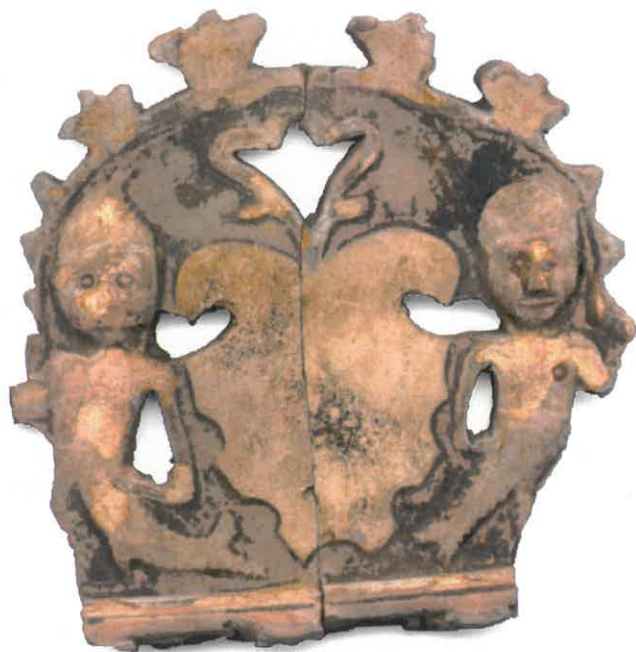
Ryc. 12. Jeden z kafli wieńczących – meluzyny trzymające tarczę herbową. Chudów – Zamek, II połowa XVI wieku.