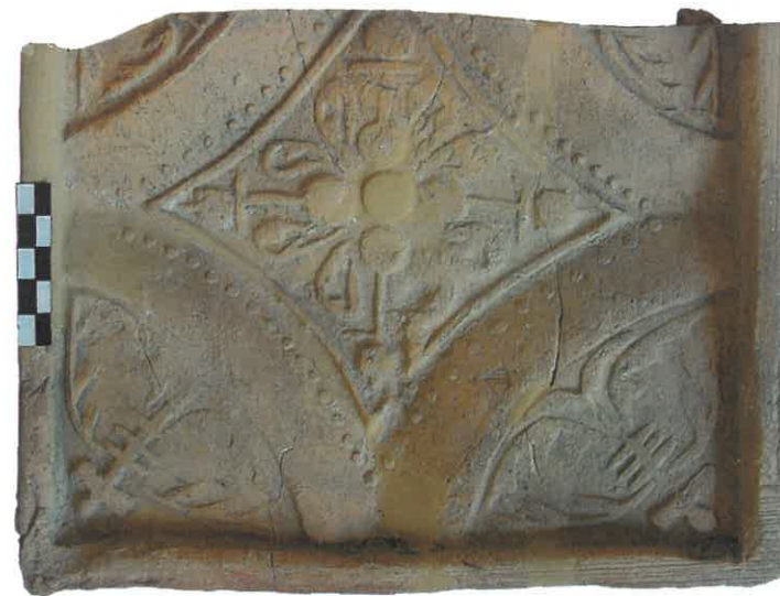
Ryc. 14. Przykład kafli ze wzorem tapetowym (egzemplarz ucięty). Chudów – Zamek, XVII wiek.