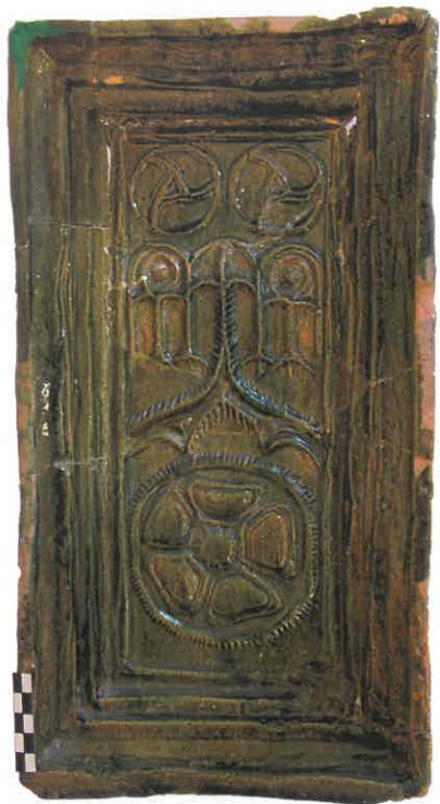
Ryc. 9. Kafel z pseudomaswerkiem i rozetą. Chudów – Zamek, I połowa XVI wieku.