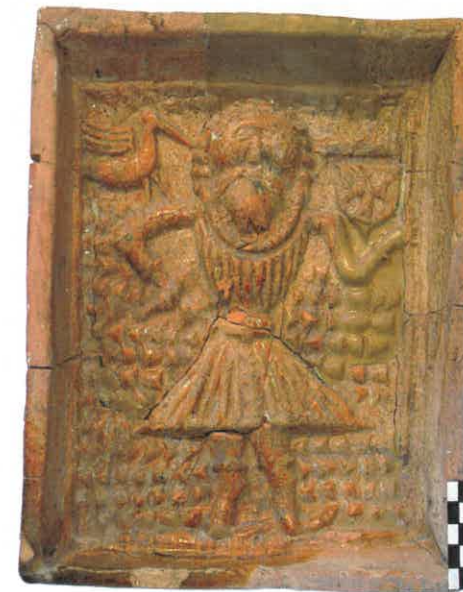
Ryc. 5. Święty Krzysztof. Chudów – Zamek, II połowa XV wieku.