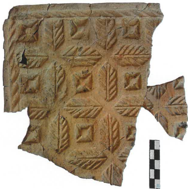
Ryc. 15. Kafel ze wzorem typu rautowego. Chudów – Zamek, XVII wiek.

Ten krótki przegląd zabytków unaocznia, iż w ponad 400-letniej historii zamku funkcjonowało prawdopodobnie kilkadziesiąt różnych urządzeń grzewczych. Duża liczba pozyskanych zabytków daje badaczowi ogromne możliwości interpretacyjne, zarówno co do ilości jak i wyglądu poszczególnych grzejników. Już w tej chwili wyodrębniono kilka pewnych konstrukcji 5 oraz rozpoznano wzory znane z innych stanowisk, jak np. w Bytomiu, Opolu, Raciborzu, Kamieńcu (pow. Zbrosławice) czy Mikołowie. Należy podkreślić, iż badania na zamku są sukcesywnie prowadzone i dlatego przedstawione w opracowaniu dane nie są pełne. Z formułowaniem ostatecznych wniosków należy więc poczekać do zakończenia prac. Zadziwia jednak fakt tak dużej różnorodności i bogactwa wzorów, które tam odkryto. Należy pamiętać, iż zamek został zbudowany przy drodze handlowej Gliwice–Mikołów, która była częścią starego szlaku z Wrocławia do Krakowa, nie zmienia to jednak faktu, że było to położenie raczej peryferyjne względem dużych ośrodków kulturowych.