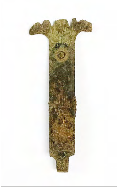
Ryc. 13. Okucie modlitewnika pozyskane w trakcie prac na stanowisku Zgierz 18.