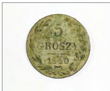
Ryc. 10. Srebrne 5 groszy z 1840 r. pozyskane w trakcie prac na stanowisku Zgierz 18.