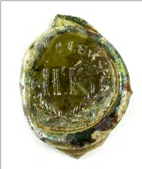
Ryc. 17. Pieczęć wytłoczona w szkle pozyskana w trakcie prac na stanowisku Zgierz 18.