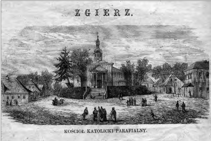
Ryc. 1. Drzeworyt z wizerunkiem kościoła parafialnego w Zgierzu, czasopismo „Kłosa”, t. XIV, 1872 r., nr 357, s. 300 (zbiory Muzeum Miasta Zgierza).