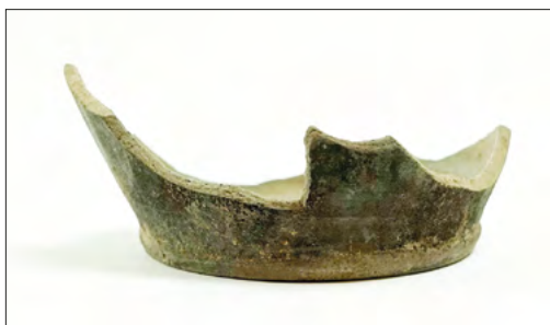
Ryc. 9. Dno naczynia pozyskanego w trakcie prac na stanowisku Zgierz 18.