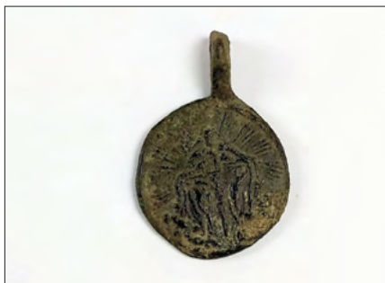
Ryc. 11. Medalik z przedstawieniem Jezusa pozyskany w trakcie prac na stanowisku Zgierz 18.