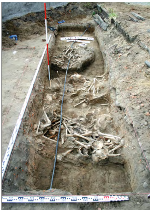
Ryc. 21. Przemieszczone kości ludzkie w wykopie v na stanowisku Zgierz 18.