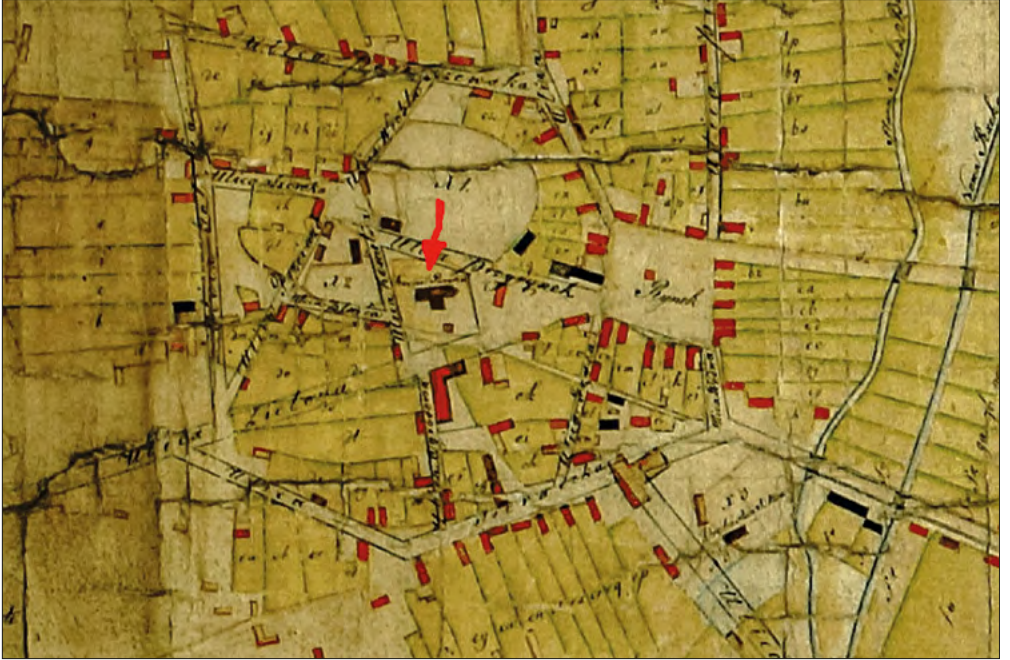
Mapa 1. Plan Zgierza, opr. J. Leszczyński w 1821/1823 r. (zbiory APŁ).