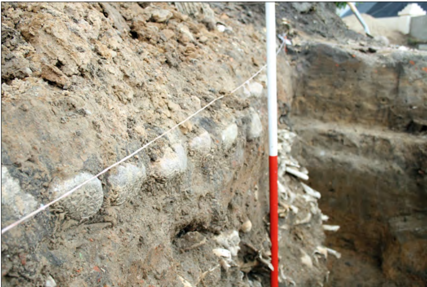
Ryc. 20. Poziom niwelacyjny xx-wiecznego terenu przykościelnego.