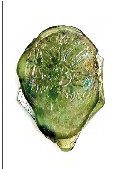
Ryc. 18. Pieczęć wytłoczona w szkle pozyskana w trakcie prac na stanowisku Zgierz 18.