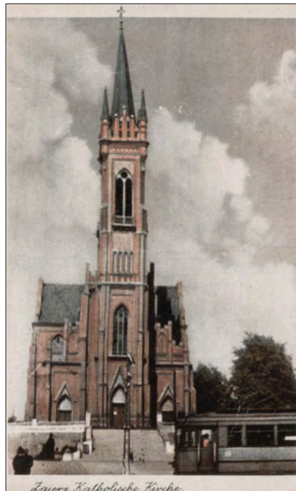
Ryc. 5. Karta pocztowa z wizerunkiem kościoła św. Katarzyny, lata 40. xx w. (zbiory Muzeum Miasta Zgierza).