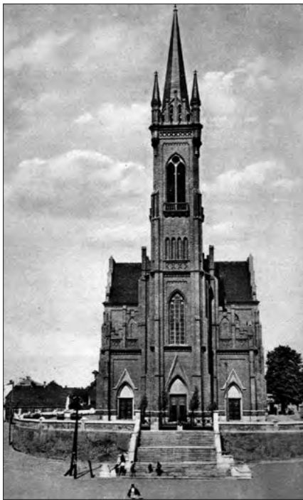
Ryc. 4. Widok kościoła pw. św. Katarzyny w Zgierzu z karty pocztowej.