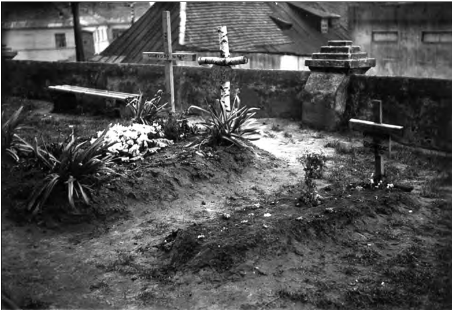
Ryc. 7. Mogiła z dwoma krzyżami, w której pochowano żołnierzy niemieckich, znajdująca się w bezpośrednim sąsiedztwie kościoła św. Katarzyny w Zgierzu, wrzesień 1939 r. (materiały Muzeum Miasta Zgierza).