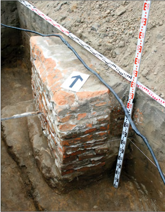
Ryc. 19. Bryła ceglana z prętem zbrojeniowym odkryta na stanowisku Zgierz 18.