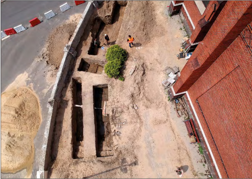
Ryc. 8. Zdjęcie z drona na stanowisko Zgierz 18.

Badania archeologiczne zorganizowano w ramach siedmiu wykopów badawczych. Łączny obszar przebadany wyniósł 50,75 m 2 . Odkryto blisko 10 000 fragmentów przemieszanych kości ludzkich. Nie zarejestrowano pochówków zachowanych w całości, ułożonych w porządku anatomicznym. Dla materiału zabytkowego znalezione w górnych warstwach określenie jego chronologii okazało się być niemożliwe. Odnotowano odwróconą stratygrafię wskazującą na to, że niższe warstwy były bardzo mocno przemieszane z warstwami wyższymi. Spowodowane to jest faktem, iż przeważająca część nasypu przykościelnego została przywieziona najprawdopodobniej z innego stanowiska (ceramika późnośredniowieczna w partiach stropowych, a poniżej ceramika nowożytna). Oprócz licznej grupy ceramiki, wydzielone zostały przedmioty szklane, pojedyncze fragmenty kafli piecowych i dachówek oraz stosunkowo duża liczba przedmiotów metalowych, wśród których znalazły się monety, medalik czy dwie obrączki. Wszystkie zabytki są chronologią zawierają się w ramach XV–XX w., z czego większość przypada na XIX i XX stulecie. Najstarsze egzemplarze ceramiczne zahaczają o koniec średniowiecza, stając się tym samym najstarszymi zabytkami znalezionymi na tym stanowisku.