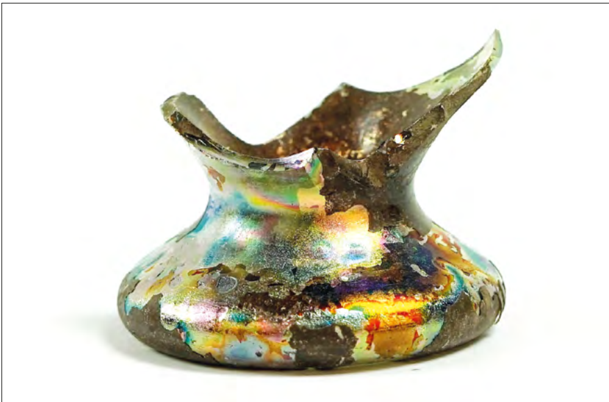
Ryc. 15. Fragment kieliszka pozyskany w trakcie prac na stanowisku Zgierz 18.