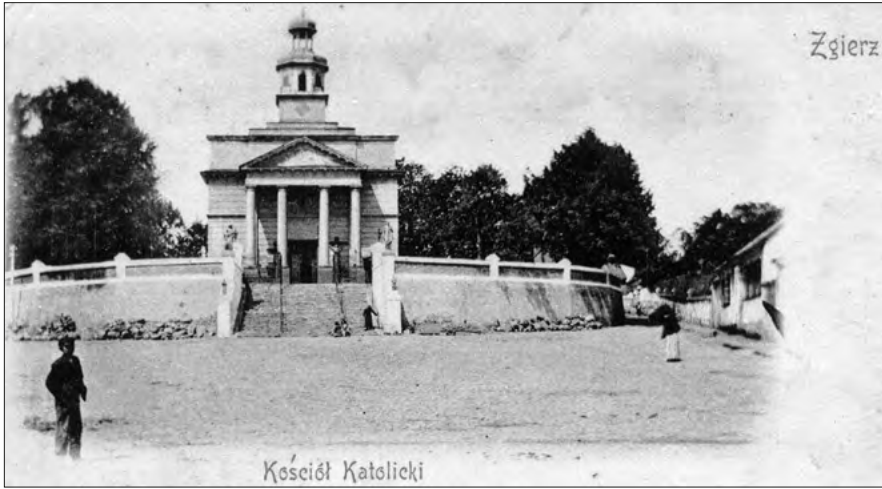
Ryc. 3. Widok kościoła parafialnego w Zgierzu z karty pocztowej.