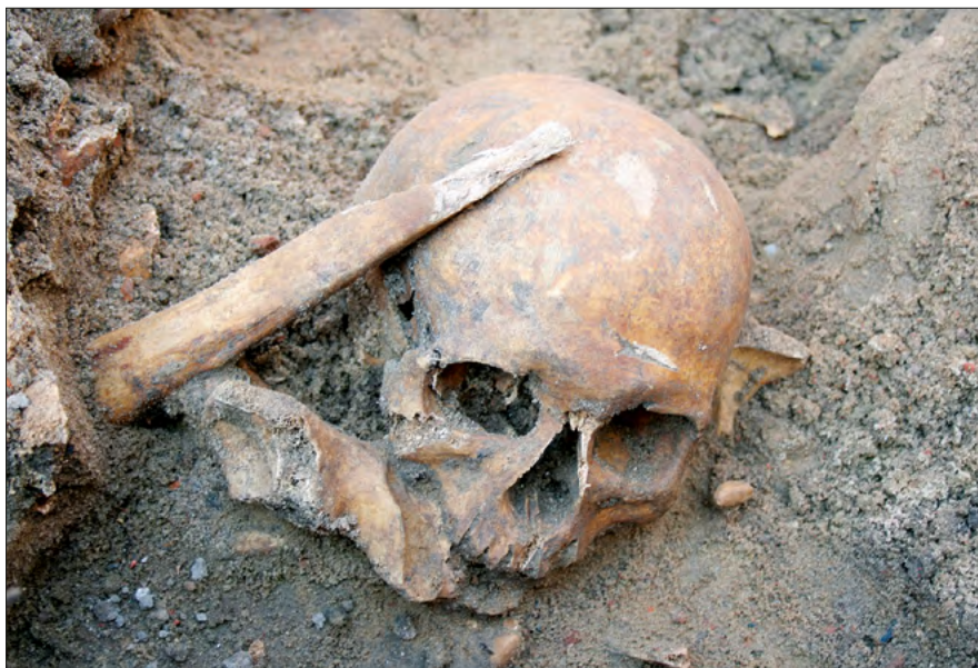
Ryc. 22. Czaszka i fragmenty kości długich z wykopu v odkryte na stanowisku Zgierz 18.