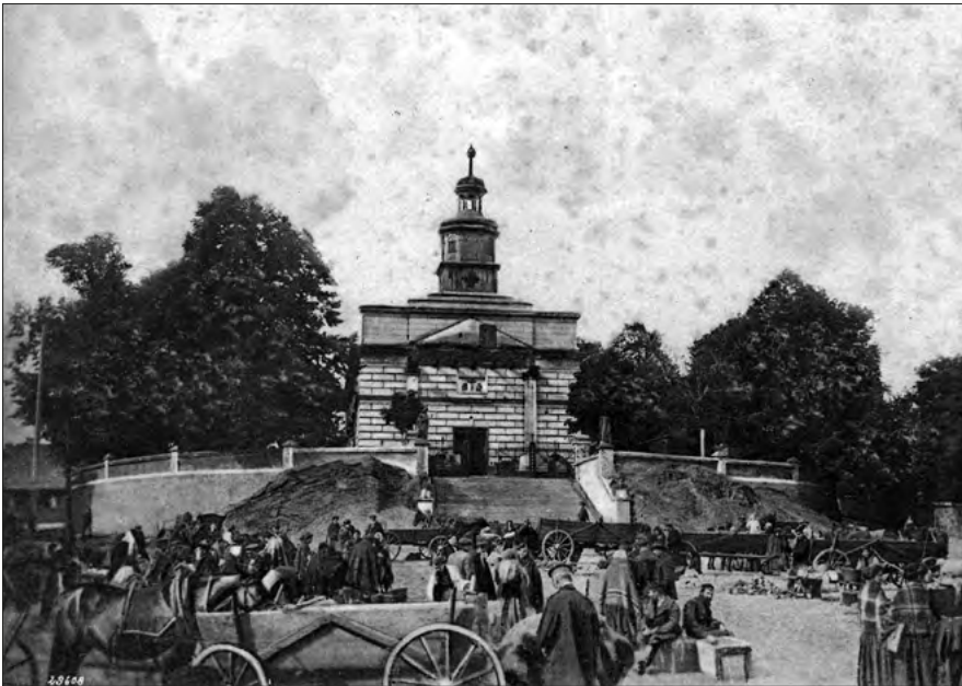
Ryc. 2. Widok kościoła parafialnego w Zgierzu z karty pocztowej z 1903 r..