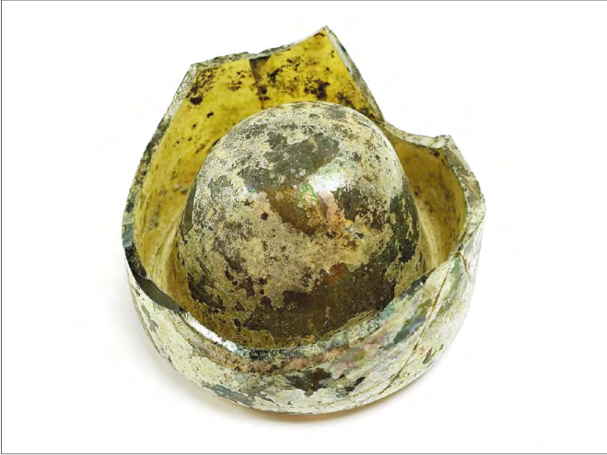
Ryc. 16. Dno butelki pozyskane w trakcie prac na stanowisku Zgierz 18 (fot. K. Wiliński).