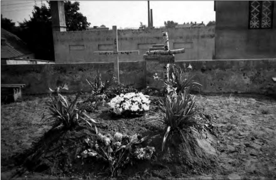
Ryc. 6. Mogiła z dwoma krzyżami, w której pochowano żołnierzy niemieckich, znajdująca się w bezpośrednim sąsiedztwie kościoła św. Katarzyny w Zgierzu, wrzesień 1939 r. (materiały Muzeum Miasta Zgierza).