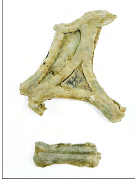
Ryc. 14. Fragmenty witraża pozyskane w trakcie prac na stanowisku Zgierz 18.