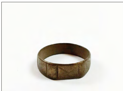
Ryc. 12. Obrączka pozyskana w trakcie prac na stanowisku Zgierz 18.

zaborów z lat: 1839 i 1840, oraz polskie grosze powojenne z 1949 r. Na jedynej dobrze zachowanej plombie widnieje symbol orła, napis cyrylicą i data 1903 r. Kraje pochodzenia tych numizmatów nie dziwią, gdyż na tych terenach w minionych wiekach były w obiegu zarówno monety rosyjskie, niemieckie, jak i polskie. W tym przypadku rysuje się nam obraz znany z kart historii, czyli Polska, w której od końca XVIII w. po czasy II wojny światowej przewijają się różne narodowości.