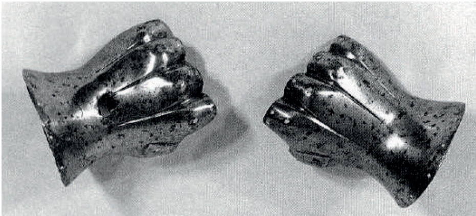
Ryc. 13. Rękawice z Katedry Chartres, ok. 1390 r. (Edge, Paddock 1991, s. 82)