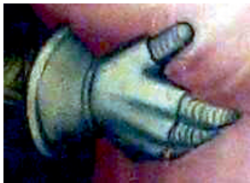
Ryc. 8. Rękawica płytowa, kwatery D1 Chrystus przed Piłatem