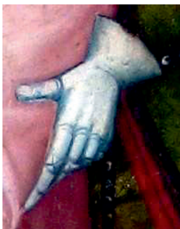
Ryc. 5. Rękawica płytowa, kwatera C1 Pojmanie