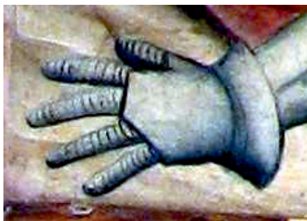
Ryc. 2. Rękawica płytowa, kwatera B4 Zmartwychwstanie