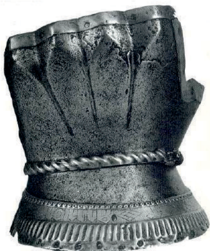
Ryc. 14. Rękawica z napisem AMOR na mankiecie, Milan ok. 1380–1400 r. (Edge, Paddock XV w., Bolesławiec nad Prosną, woj. kaliskie 1991, s. 86)