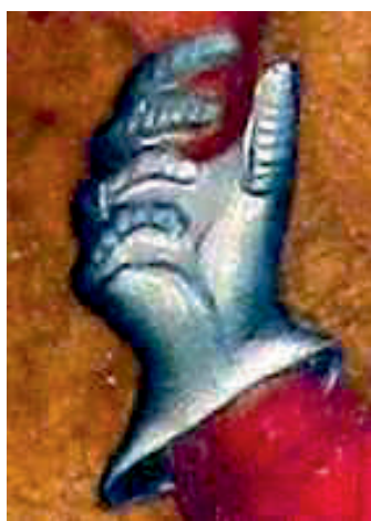
Ryc. 3. Rękawica płytowa z widocznym wnętrzem, kwatera C1 Pojmanie