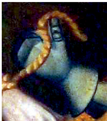
Ryc. 9. Rękawica płytowa, kwatery D1 Chrystus przed Piłatem

wany na przełom XIV/XV wieku (Nowakowski 1990, s. 82). Fragment ten stanowi anatomicznie uformowane śródręcze (ryc. 15).