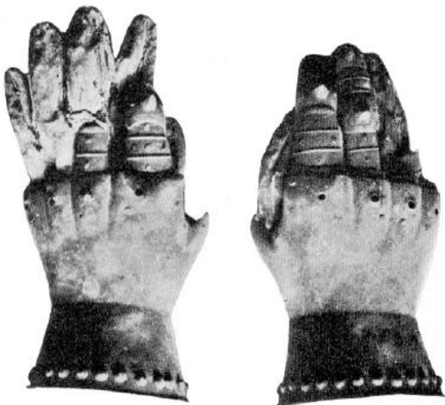
Ryc. 10. Rękawice Edwarda III Czarnego, Księcia Walii, 1376 r. (Thordeman 1939, s. 235, fig. 213)

poszczególnych elementów rękawic, mocowanie ich do skórzanego podkładu czy bezpośrednio do miękkiej rękawicy wykonanej z materiałów organicznych. Być może artysta zwyczajnie je przeoczył w trakcie malowania kwater, lecz dziwne wydaje się, że błąd popełniono w każdym bez wyjątku przypadku. Przykładem rękawic, w których zachowały się nity a także otwory będące śladami po ozdobnych tarczках oraz miękkie rękawice wykonane ze skóry mogą być doskonale zachowane egzemplarze (ryc. 10) należące do Edwarda III Czarnego, Księcia Walii zmarłego w 1376 roku (Thordeman 1939, s. 235). Innym przykładem rękawic mających widoczne nity i otwory pod nie oraz doskonale zachowane miękkie rękawice tekstylne są zabytki znajdujące się w zbiorach Zamku Churburg datowane na 1390 rok (ryc. 16–17; Paggiarino, Blair, Eavens 2006, s. 280). Rękawice należące do Czarnego Księcia swą formą nawiązują do typu pierwszego rękawic ukazanych na Poliptyku Grudziądzkim, natomiast zabytek przechowywany w Zamku Churburg ma anatomicz-