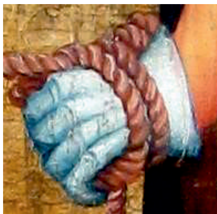
Ryc. 6. Rękawica płytowa, kwatera C2 Dźwiganie Krzyża