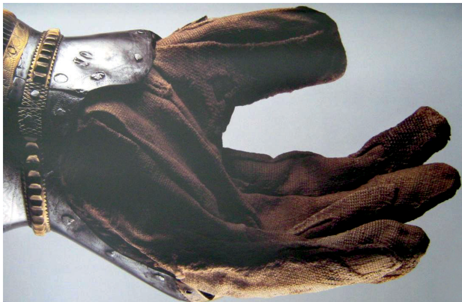
Ryc. 17. Widok wnętrza rękawicy płytowej, Północne Włochy, Milan, ok. 1390 r. (Paggiarino, Blair, Eavens 2006, s. 42)