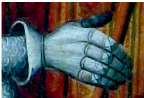
Ryc. 1. Rękawica płytowa, kwatera B4 Zmartwychwstanie