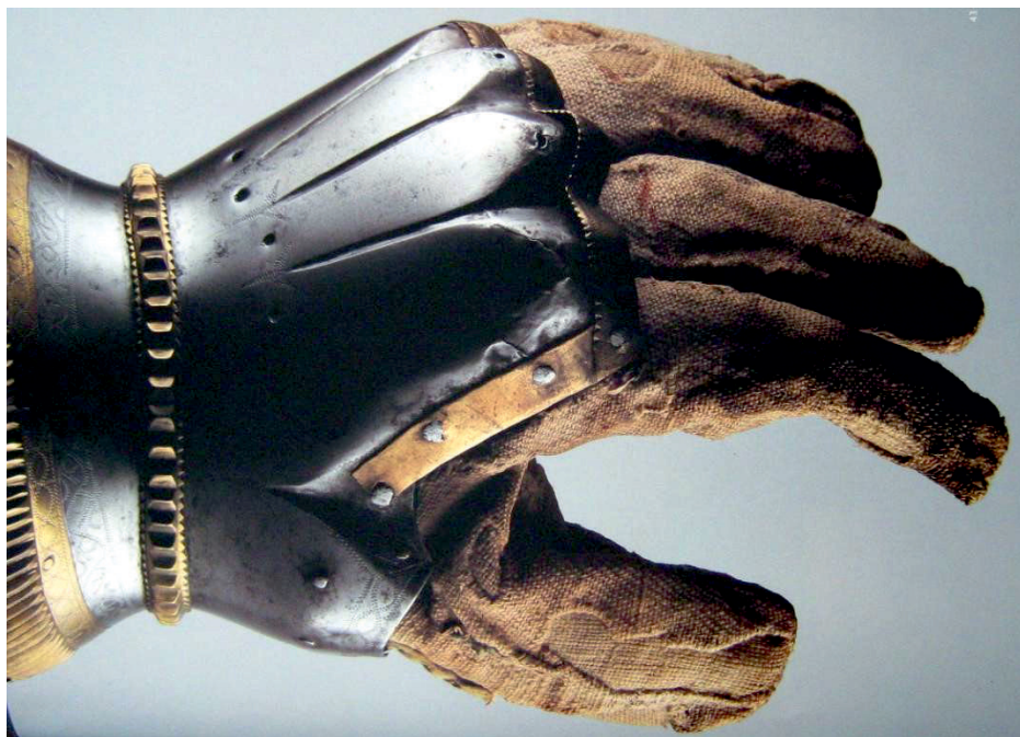
Ryc. 16. Rękawica płytowa od zewnątrz, Północne Włochy, Milan, ok. 1390 r. (Paggiarino, Blair, Eavens 2006, s. 43)