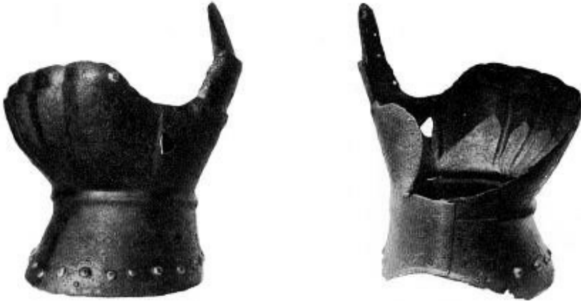
Ryc. 12. Rękawice z Zamku Örum w Danii, XIV w. (Thordeman 1939, s. 237, fig. 217)