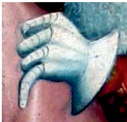
Ryc. 4. Rękawica płytowa, kwatera C1 Pojmanie