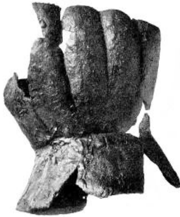
Ryc. 11. Rękawica z Alсно Hus, Szwecja ok. 1390 r. (Thordeman 1939, s. 236, fig. 215)