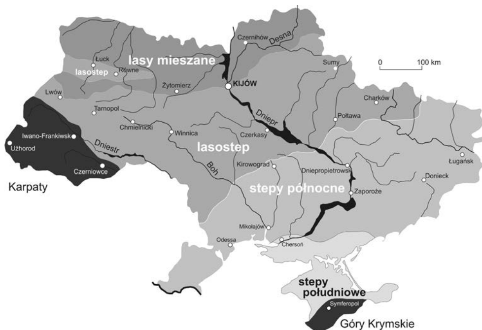
Ryc. 1. Strefy przyrodniczo-geograficzne Ukrainy (źródło: Zastawnij, Kusiński 2003, za Makohonienko 2011).

Ukrainę – część Wołynia i Podola, oraz część lewobrzeżnej Ukrainy na Nizinie Naddnieprzańskiej (ryc. 1; Makohonienko 2009, 2011, s. 24, ryc. 4). Budownictwo grodowe ma tu długą historię, dopiero jednak początek epoki żelaza przyniósł prawdziwy „boom” w jego rozwoju. Nigdy wcześniej zjawisko to nie było tak powszechne i nie miało tak systemowego charakteru (Дарган, Камыба, Паzymов 2010). Fakty związane z powstaniem grodów mogą być interpretowane na wiele sposobów, a za czynniki kluczowe w wyjaśnianiu ich genezy mogą uchodzić kwestie polityczne, społeczno-ekonomiczne, a także urbanizacyjne i militarne.