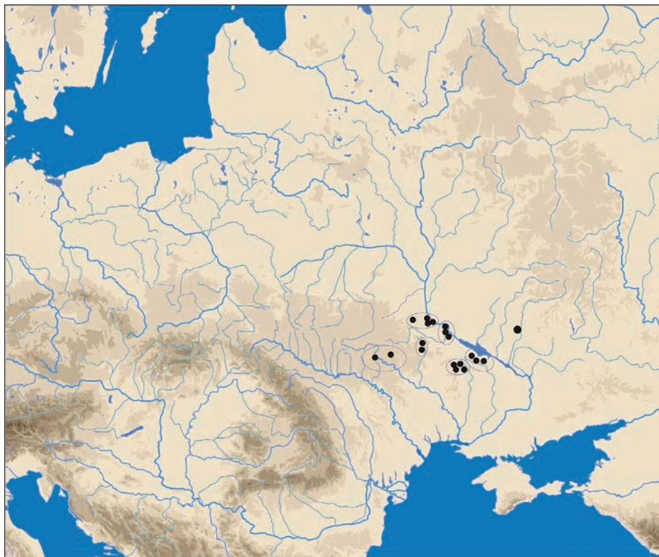
Ryc. 2. Strefy występowania grodzisk na obszarze lasostępu ukraińskiego. Granice „zespołów” na podstawie definicji J. Boltryka (Болтрик 1993) z uzupełnieniami autora

fie tej znajdowało się co najmniej osiem grodzisk: Severinovka (Severynivka), Grizki (Hryshky), Zgarok (Zharok), Derażnia (Derazhnya), Gumiency (Humentsi), Iwankiwcy (Ivankivtsi), Kniagin (Kniahinin) oraz największe spośród nich, zlokalizowane w Niemirowie (Niemirow). Zespół ten jest specyficzny także z perspektywy rozmiarów zakładanych tutaj warowni, ponieważ poza „głównym” grodziskiem w Niemirowie wszystkie pozostałe mają stosunkowo małe rozmiary (rzędu 5 ha).