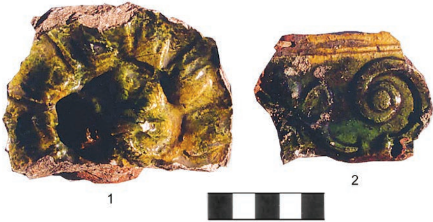
Ryc. 7. Chęciny, zamek. Fragment płytki czołowej kafała (1) z rozetą (centralny pęk) oraz kafała gzymsowego (?) z ornamentem roślinnym (2).