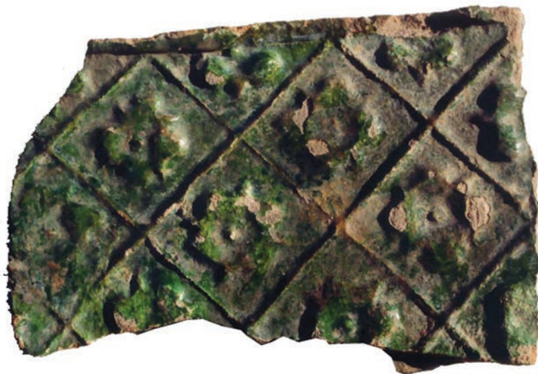
Ryc. 9. Chęciny, zamek. Fragment płytki czołowej kafała zdobionego motywem ukośnej kratki z kwiatkami.