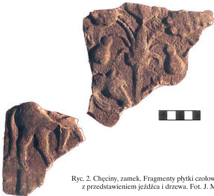
Ryc. 2. Chęciny, zamek. Fragmenty płytki czołowej kafli z przedstawieniem jeźdźca i drzewa.

że nie jest możliwe ich wykorzystanie dla ustaleń stratygraficznych. Z przytoczonych sprawozdań wynika, że duże ilości zabytków ruchomych odegrały niebagatelną rolę w ustaleniach dotyczących faz rozwojowych obiektu. Wśród tych znalezisk znajdowały się zespoły fragmentów kafli płytowych. Niestety, wspomniane braki uniemożliwiają próbę ewentualnej weryfikacji poczynionych wówczas obserwacji.