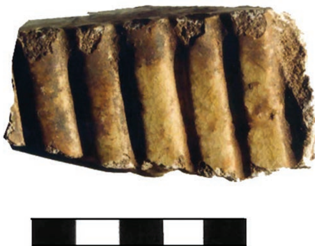
Ryc. 12. Chęciny, zamek. Fragment kafła zdobionego wypukłymi półwałkami.