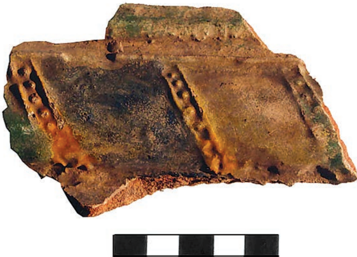
Ryc. 8. Chęciny, zamek. Fragment obramienia płytki czołowej lub kafała gzymsowego z motywem ukośnej wstęgi z rzędem kropek.