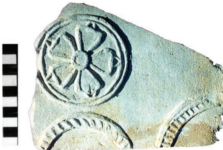
Ryc. 5. Chęciny, zamek. Fragment płytki ceramicznej z przedstawieniem herbu Poraj.