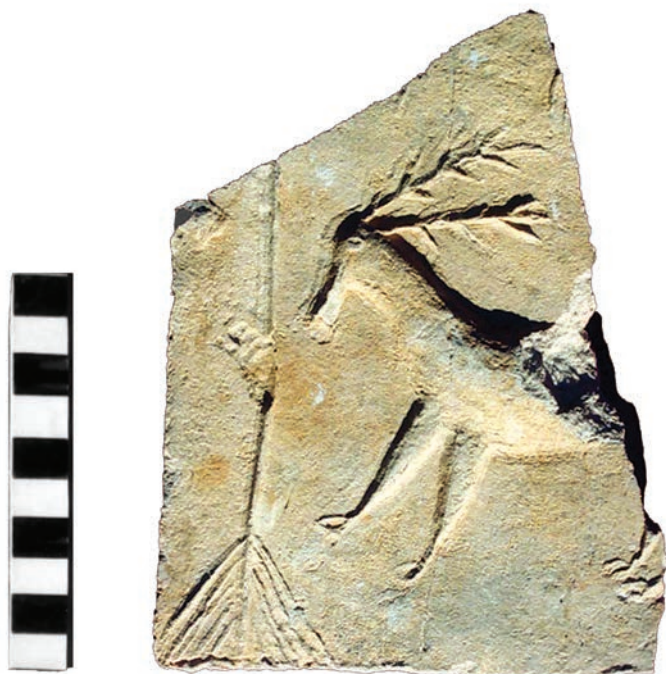
Ryc. 3. Chęciny, zamek. Fragment płytki ceramicznej z przedstawieniem jelenia w lewo i drzewa.

syczne kafle płytowe. Stylistyka ich reliefowej dekoracji zdaje się jednak świadczyć o tym, że były wykonane za pomocą tych samych matryc, które służyły do wyrobu płytek czołowych kafli. Być może są to fragmenty zwieńczenia pieców (?). Podobnie jak w przypadku klasycznych kafli, głównym kryterium oceny chronologii tych płytek będzie analiza stylistyczna umieszczonych na nich wyobrażeń. Pozycja stratygraficzna wszystkich wymienionych znalezisk nie jest znana.