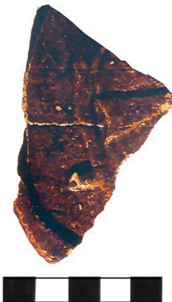
Ryc. 6. Chęciny, zamek, badania 1974 r. Fragment płytki czołowej kafła z przedstawieniem herbu Jastrzębiec.