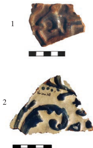
Ryc. 11. Chęciny, zamek. Fragment płytki czołowej kafła zdobionego motywem maureski (?) z ciemnoniebieską polewą (1). Fragment płytki czołowej kafła ze stylizowaną ornamentyką roślinną, niebieską na białym tle (2).