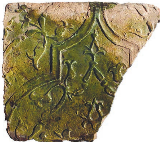
Ryc. 10. Chęciny, zamek. Fragment płytki czołowej kafała zdobionego motywem maureski.