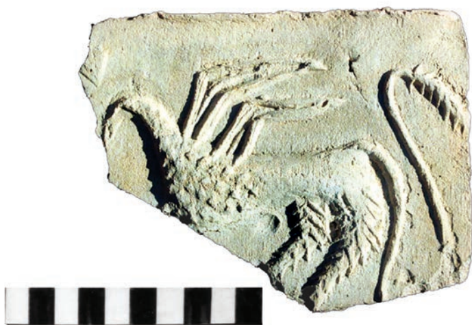
Ryc. 4. Chęciny, zamek. Fragment płytki ceramicznej z przedstawieniem gryfa w lewo.

z Biecza, określonego jako gotycki 22 , oraz na kaflu z zamku w Szaflarach 23 . Różnią się one co prawda szczegółami, ale styl i maniera są podobne. Można je dość pewnie powiązać z rozwiniętym lub schyłkowym gotykiem. Z kolei drzewo z płytki chęcińskiej (jego dolna część z rozchodzącymi się jodełkowato korzeniami) przedstawiono podobnie jak drzewa na znanym kaflu wawelskim z wyobrażeniem lasu 24 . Datowanie tego ostatniego na XV–XVI w. oparte jest na kaflu z Liptovskiej Mary na Słowacji 25 .