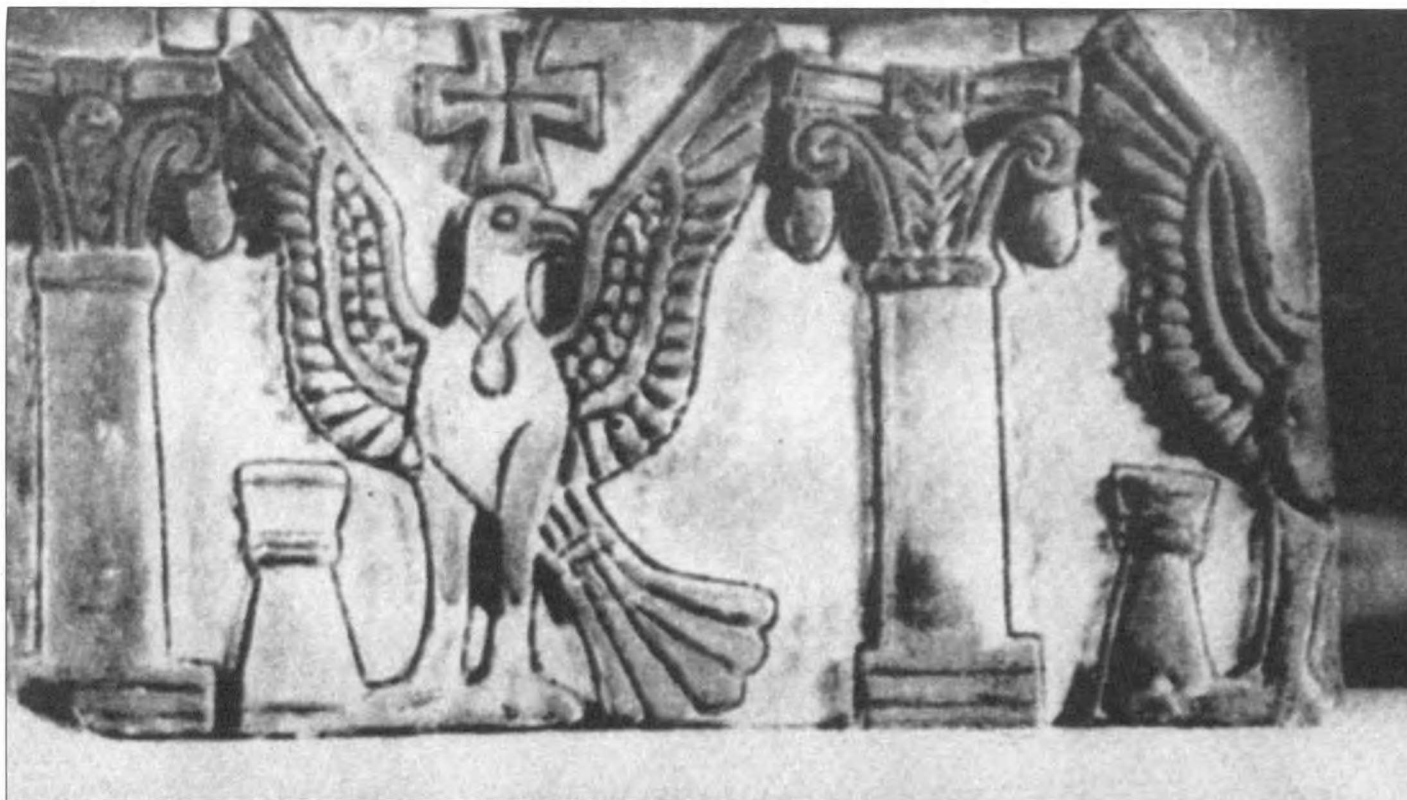
1. Fragment fryzu z Pierwszej Katedry w Faras, British Museum, nr 606