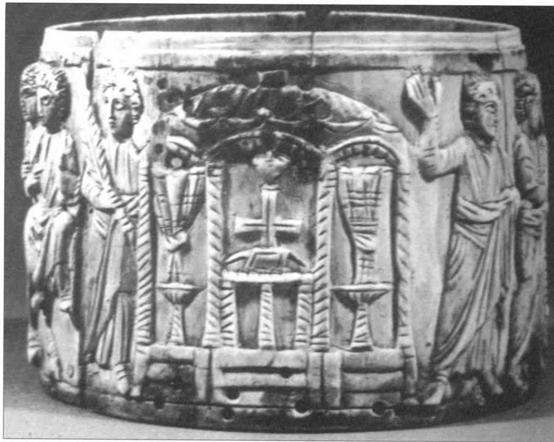
3. Pyxis z Cleveland (Za: St. Clair 1979, fig. 9)