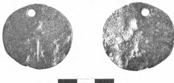
Fot. 1. Brązowa zawieszka z przedstawieniem antropomorficznym Photo 1. Bronzeanhänger mit anthropomorphischer Darstellung

Kolejną brązową ozdobą jest zawieszka z wybitą sylwetką ludzką (fot. 1). Zabytek ten nie znajduje w ogóle analogii, zarówno na terenie przeworskim, jak i na ziemiach ościennych. Swoim kształtem może nawiązywać do wisiorów kapsułkowatych, ewentualnie do sporadycznie znajdujących w kulturze przeworskiej, kolistych zawieszek wykonanych z różnych surowców. Ozdoby tego typu pochodzą z osady w Obrowcu (GODŁOWSKI 1973, s. 326–327, tabl. XIX: 8), z cmentarzysk w Wąchocku (BALKE, BENDER 1991,