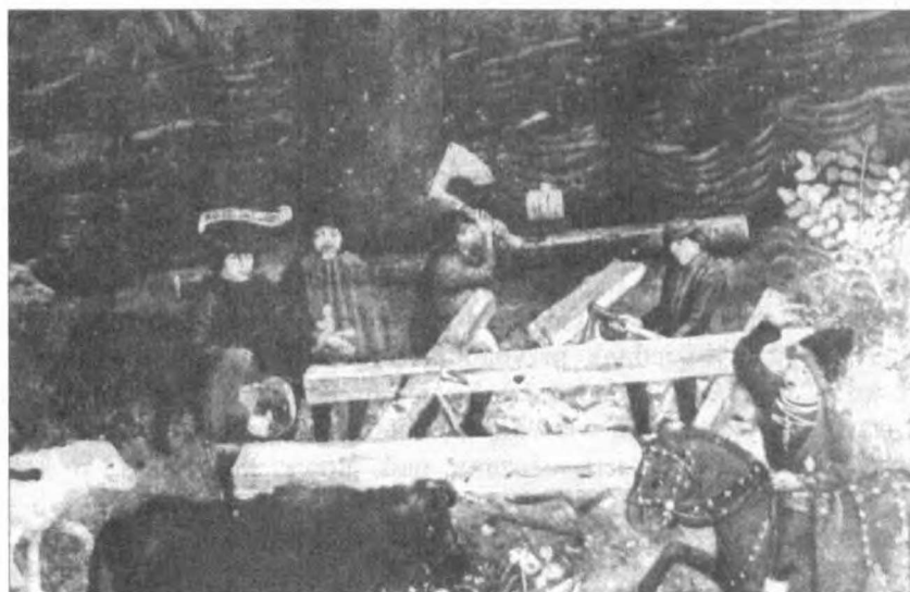
Ilustr. 3. Fragment zaginionego obrazu „Oblężenie Malborka” z lat 1481–1488