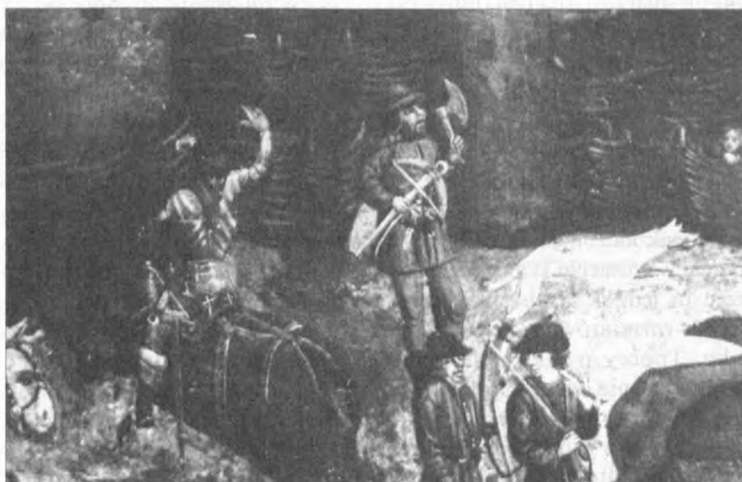
Ilustr. 2. Fragment zaginionego obrazu „Oblężenie Malborka” z lat 1481–1488