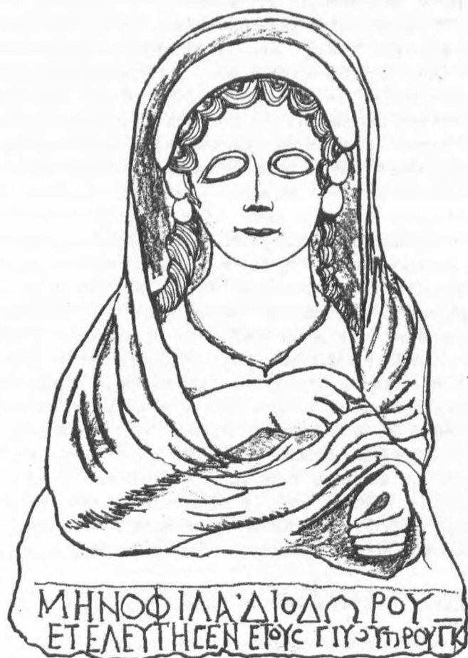
Rys. 4. Portret grobowy Menofilii, córki Diodora, Muzeum Narodowe, Kopenhaga (nr inw. 8 A 10). Rysunek autorki

wizerunki in formam deorum . Popiersie Treptos 43 ukazane jest jakby w świątynce, pod muszlą, symbolem Afrodyty, i spoczywa na wieńcu z liści akantu. Przedstawiona w stylu ludowym nieznana kobieta, nosząca fryzurę z lokami