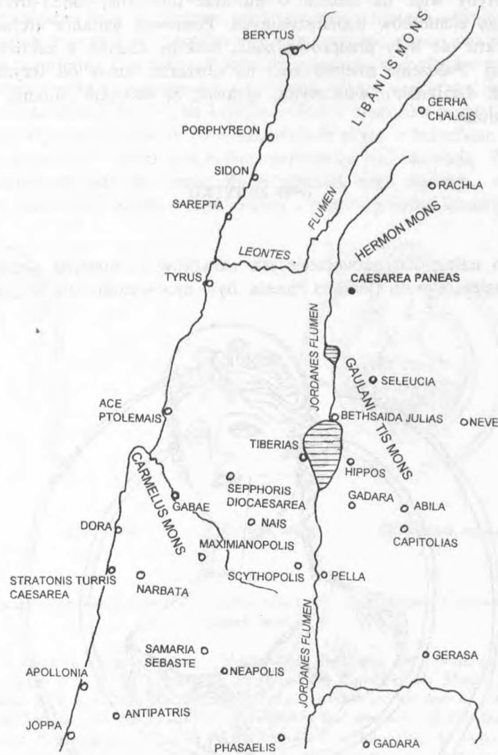
Rys. 1. Południowa Syria w okresie rzymskim. Rysunek autorki

jeziora Semachonitis 10 . Nowy Testament 11 wzmiankuje o wioskach Caesarei Paneas jakby to były rozległe tereny, które można porównać do posiadłości