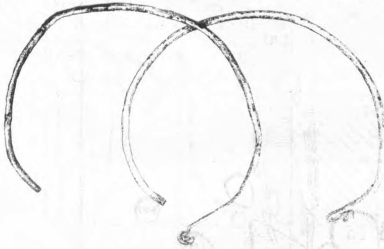
Rys. 3. Wyposażenie grobu nr 11. Kabłączki skroniowe, typ III

Grób nr 12 (rys. 3) pozostałości grobu szkieletowego - kości czaszki. Układ kości szkieletu bliżej nieokreślony, bardzo słabo widoczny zarys jamy grobowej sugeruje ułożenie zwłok analogicz-