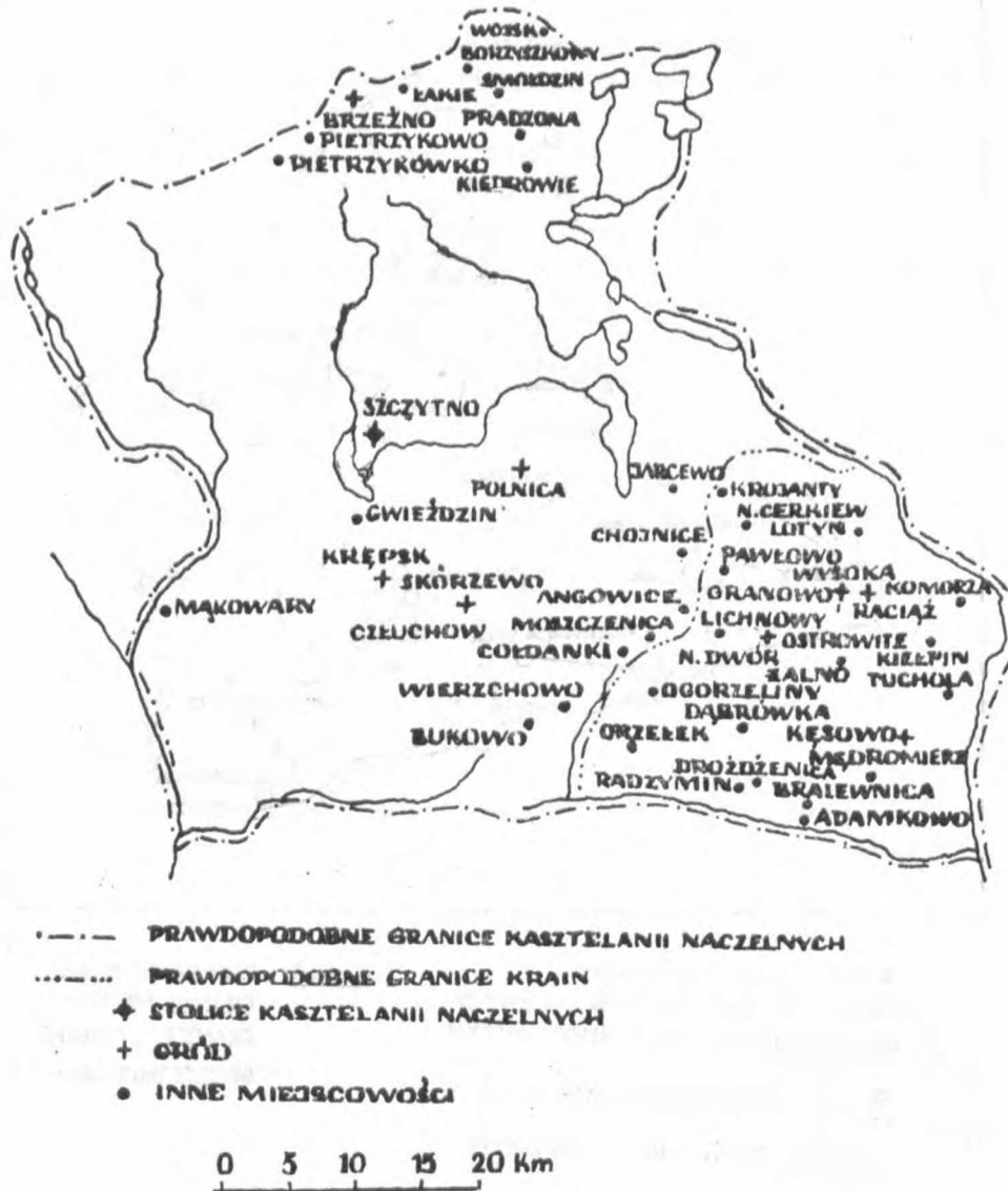
Rys. 3. Granice kasztelanii raciąskiej i szczycieńskiej (wg Śląski, op. cit. )

natomiast pozostałe odtworzono na podstawie podziałów kościelnych z XVI w.