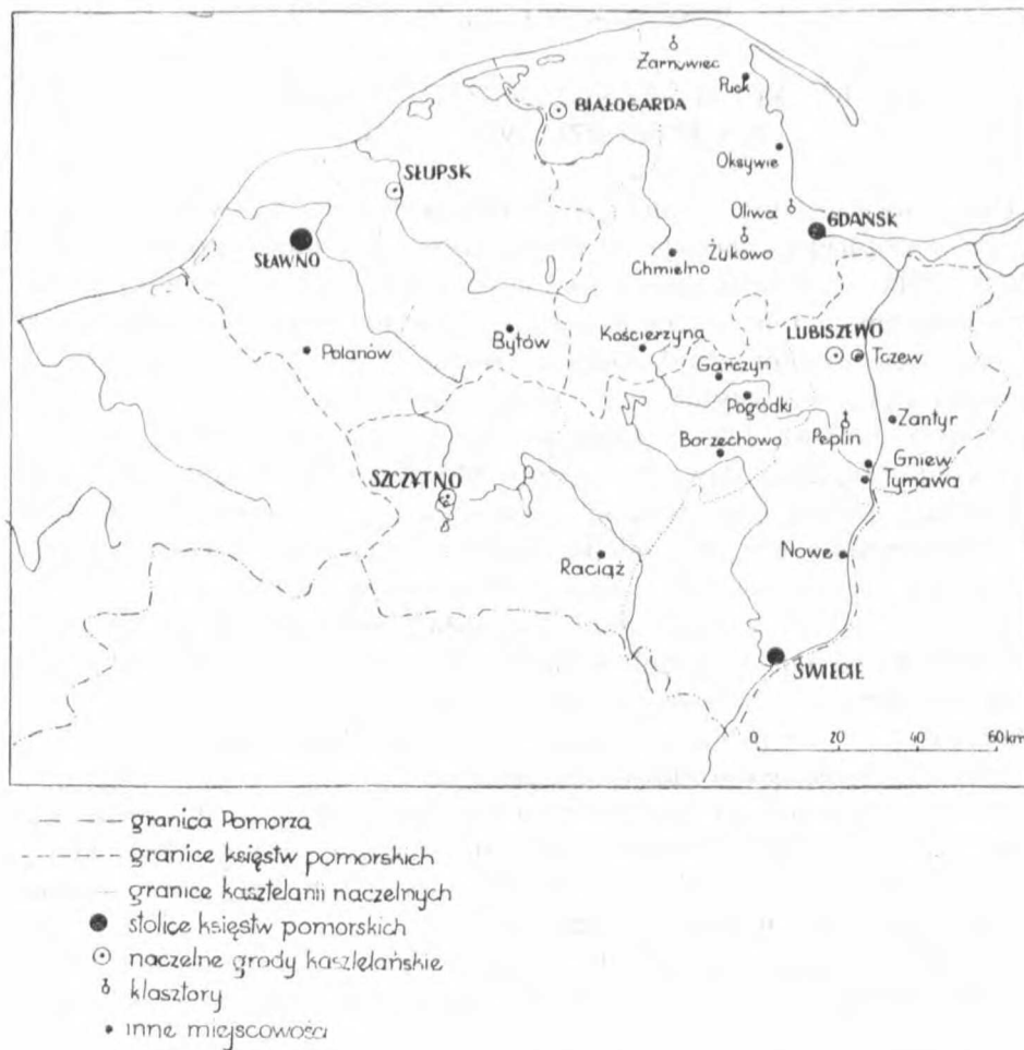
Rys. 1. Księstwo gdańskie, słupsko-sławieńskie i świeckie w pierwszej połowie XIII w. (wg K. Ślaski, Podziały terytorialne Pomorza w XII—XIII wieku , Poznań 1960)

XI w. ukształtowała się na Pomorzu władza książęca, a system organizacji grodowej i jej naczelnicy podlegał władzy jednego księcia. Podbój Pomorza w latach 1113—1123 doprowadził do zjednoczenia poli-