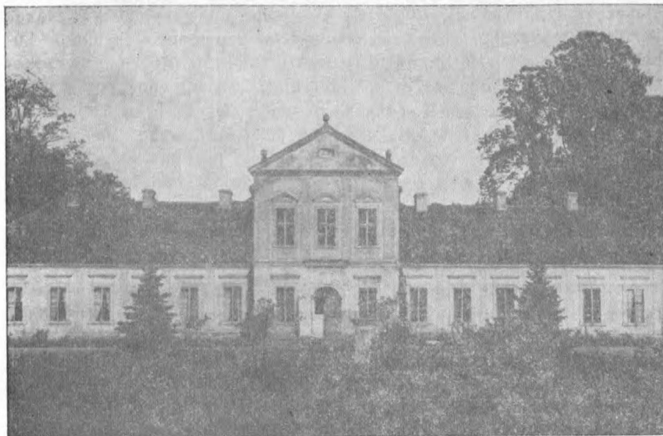
Fot. 2. Sokolniki, woj. kaliskie — pałac, elewacja frontowa

z licznych realizacji budowli sakralnych: Łąd, Leszno — kościół Św. Krzyża, Osieczna a także pałacowych: przebudowa rezydencji biskupów poznańskich w Poznaniu, przebudowy i wystrój wnętrza pałacu w Rydzynie, przeróbki pałacu w Lesznie itp. Obaj architekci pozostawali w orbicie wpływów rodziny Leszczyńskich (potem Sułkowskich), obaj posiadali tego samego współpracownika i kontynuatora wielkich budów: Czecha Jana Adama Stiera. Choć jest to tylko niczym nie potwierdzona hipoteza, znajomość sytuacji budowlanej w Wielkopolsce I połowy XVIII w. i analiza zachowanych realizacji obu architektów pozwala wysnuć wniosek, że ewentualnym projektantem (czy tylko wykonawcą) pałacu w Sokolnikach mógł być właśnie J. A. Stier. Naturalnie atrybucja ta nie może być przyjęta bez głębszej analizy archiwaliów obu magnackich rodzin wielkopolskich. Pałac Sułkowskich, otoczony oficynami i „ogrodem włoskim” i zabudowaniami gospodarczymi rozebrany został po nabyciu Sokolnik przez Ł. Bnińskiego. Ostatni jego opis (por. aneks 2) wskazuje na znaczne zużycie techniczne drewnianej, fundamentowanej budowli, a barokowa siedziba nie odpowiadała już wymaganiom Łukasza Bnińskiego. Wydaje się, że „stary pałac” zaczęto rozbierać w 1775 r. Już pobieżna analiza źródeł pisanych wskazuje na atrakcyjność bardziej wnikliwego podjęcia tej problematyki.