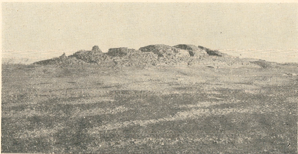
Rys. 1. Ogólny widok pozostałości Mastaby II w Oazie Dahkla

Mastaby V, gdzie w warstwach najniższych został odkryty nienaruszony dotąd grób gubernatora z VI dynastii.