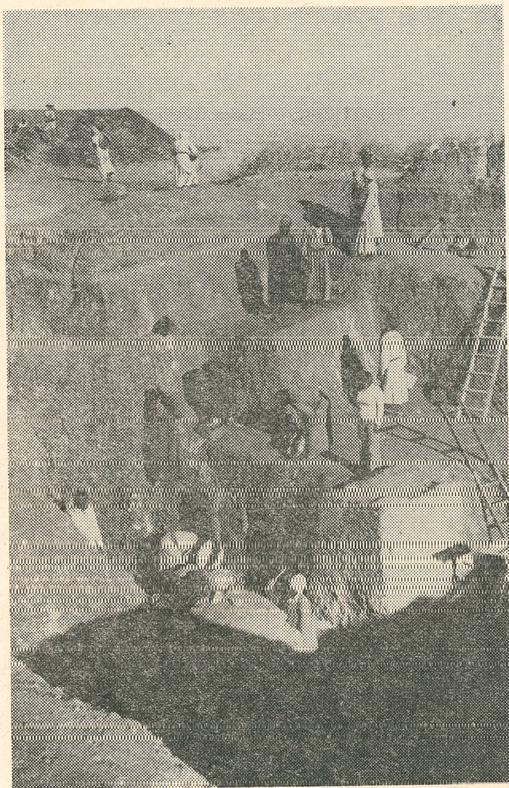
Rys. 3. Odkrywanie grobu gubernatora z VI dynastii w obrębie infrastruktury Mastaby V

nosiła 6,1 lat, co zresztą niewiele nam mówi, wiadomo bowiem, że szczątki noworodków i małych dzieci zachowują się zawsze gorzej.