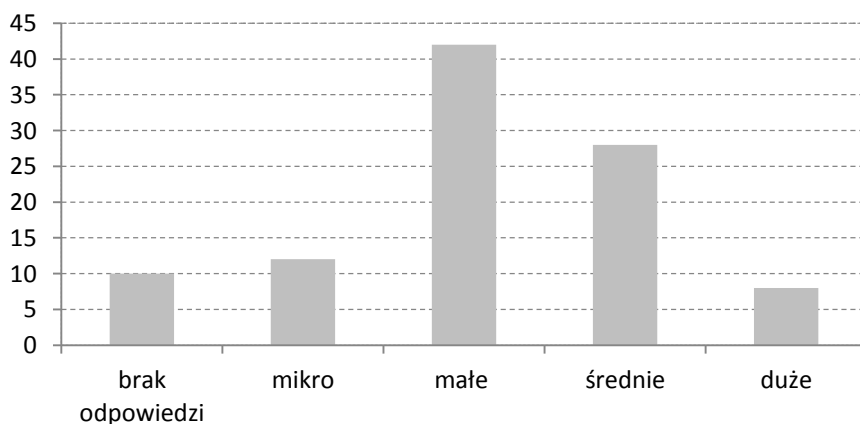
Wykres 1. Struktura badanych przedsiębiorstw ze względu na wielkość.

Blisko połowę (42%) stanowiły przedsiębiorstwa małe - zatrudniające do 49 pracowników, z rocznym obrotem i/lub całkowitym bilansem rocznym nie przekraczającym 10 milionów EUR 30 . Rozkład badanej populacji ze względu na wielkość przedsiębiorstwa prezentuje wykres 1.