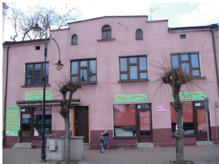
Ryc. 6. Przykład szyldów kontrastujących kolorystycznie z elewacją frontową, ul. Rynek 3 w Uniejowie