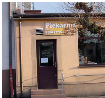
Ryc. 5. Przykład harmonizującego kolorystycznie szyldu na elewacji frontowej, ul. Rynek 15 w Uniejowie

Wspomniano już o niewłaściwej kolorystyce i fakcie umieszczania reklam w granicach analizowanego obszaru przez firmy nie prowadzące tam bezpośrednio działalności. Kolejnym czynnikiem wpływającym negatywnie na ocenę całościową reklamy zewnętrznej na badanym obszarze jest adekwatność umieszczenia reklamy w konkretnym miejscu. Reklamy znajdujące się na drzewach i latarniach wymagają usunięcia. Racjonalizacji wymagają także reklamy umieszczane na budynkach i płotach, zwłaszcza gdy występuje ich duże nagromadzenie w jednym miejscu (ryc. 3).