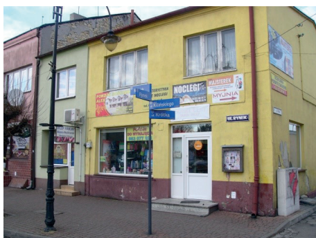
Ryc. 2. Reklamy zewnętrzne przy skrzyżowaniu ulic Rynek i Krótkiej w Uniejowie

Formą reklamy zewnętrznej zyskującą na popularności w polskich miastach jest reklama LED. Wyświetla ona komunikat w postaci tekstu lub obrazu, często imitując ruch. W uniejowskim rynku zainstalowano jedną tego typu reklamę. Znajduje się ona na budynku Hotelu Staromiejskiego. Ta forma reklamy jest o tyle inwazyjna, że tworzy w krajobrazie dodatkowy element ruchomy, który skupia na sobie uwagę, dominując nad przestrzenią sąsiadującą 21 . Zwraca się uwagę na szczególne zagrożenie związane z reklamą LED dla kierowców. Reklamy takie ze względu na przyjętą kolorystykę, zbyt silne światło i sytuowanie ich przy drogach i skrzyżowaniach, mogą rozpraszać uwagę podróżnych, i potencjalnie zmniejszać bezpieczeństwo na drogach 22 .