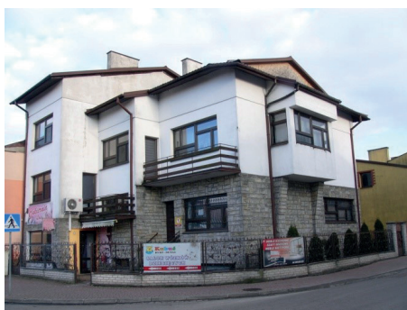
Ryc. 3. Reklamy zewnętrzne przy skrzyżowaniu ulic Rynek i Błogosławionego Bogumiła w Uniejowie

Znaczące jest, że aż 55% reklam w przestrzeni rynku w Uniejowie nie jest powiązane z działalnościami gospodarczymi, zlokalizowanymi na jego obszarze. Korzystają z tej możliwości choćby pensjonaty, co powiązane jest z rozwojem